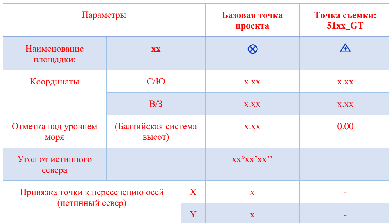
[Таблица 6 – Пример заполнения протокола ЦИМ]

12.2.4. [В соответствии с таблицей 6, необходимо предусматривать в ЦИМ: